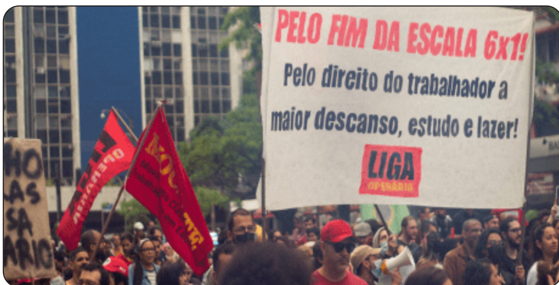
O povo nas ruas exigem o fim da escala 6x1, por mais horas de lazer, cultura, convívio com a família e repouso.

Porém, a proposta de redução da jornada de trabalho aprovada foi a de redução de 44 horas para 42 horas semanais e Escala 5x2, que deve obedecer ao prazo de 2 meses da validade da PEC e só após 14 meses de sua publicação poderá ser de 40 horas semanais. O pelego-mor – digo, o presidente Luiz Inácio conseguiu meter uma “cunha” na Câmara dos Deputados e, mesmo que de forma eleitoreira, forçou muitos deputados destacados defensores da extrema-direita, antipovo, a votar contra a escala 6x1 no primeiro e segundo turno, a Escala 5x2, enviando-a à Comissão de Constituição e Justiça – CCJ do Senado e depois vai para o Executivo sancioná-la.