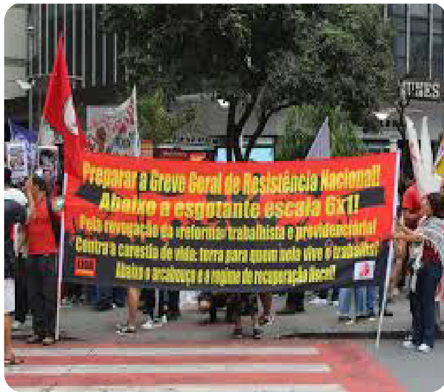
Marreta aponta o caminho: Preparar a Greve Geral de Resistência Nacional

Durante esse processo de adequação, teremos que revisar acordos e contratos de trabalho e firmar Acordo Coletivo de Trabalho, para que atender a nova regra da Escala 5x2. Devemos nos manter mobilizados e nos preparar para a jornada de lutas.