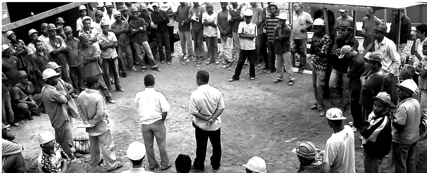
Reunião no canteiro de obra para preparar a campanha salarial