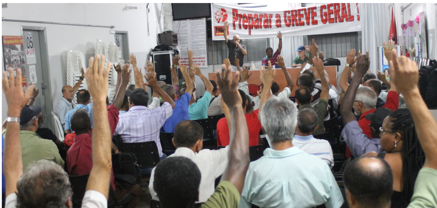
Operários aprovam pauta de luta do Marreta em assembleia geral da campanha salarial

Companheiros, como vocês já sabem, pois o Marreta cotidianamente informa aos trabalhadores em que pé anda a nossa Campanha Salarial e das artimanhas dos patrões, para cortarem nossos direitos. Mais uma vez o Marreta, está convocando todos os trabalhadores da categoria das obras ou escritórios, para decidirmos novos rumos à Campanha.