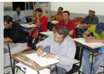
Escola Popular Orcílio Martins Gonçalves