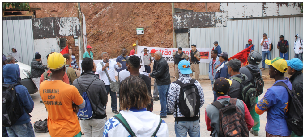
Operários da MRV do bairro Buritis em greve - dez. 2016

Em nossa assembleia dia 06/01, vários trabalhadores administrativos se manifestaram dizendo que não aceitam o desligamento com o Marreta e denunciaram as falcatruas da MRV, que está empenhada em criar divisão na categoria e inclusive impondo aos trabalhadores da administração a