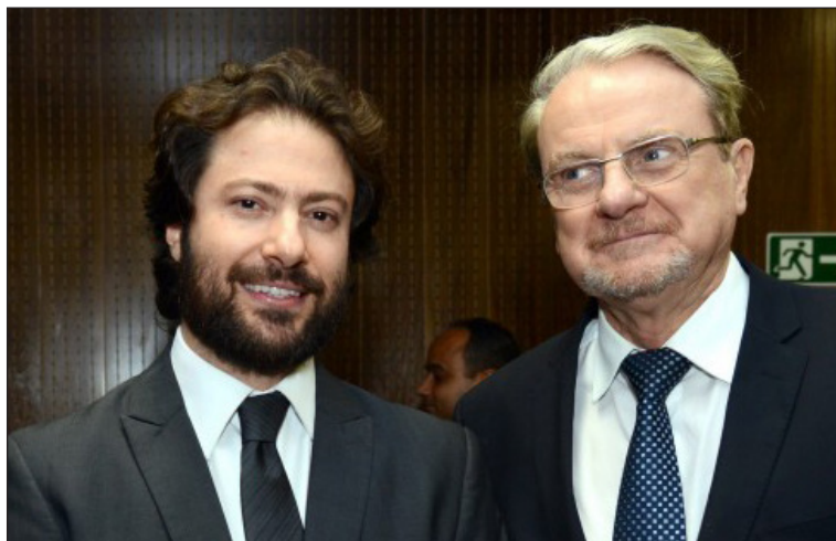
Presidente do Sinduscon-MG ao lado do prefeito de BH

O Sinduscon foi convocado para participar de 3 reuniões de negociação (26 e 27 /11 no Ministério do Trabalho e no dia 03/12 no Ministério Público do Trabalho) e fugiu de todas. Acham que não têm nenhuma satisfação a dar aos trabalhadores? Se consideram seguros com esquemas mafiosos com os governantes? Acham que podem usar o desemprego para pisar ainda mais sobre os trabalhadores?