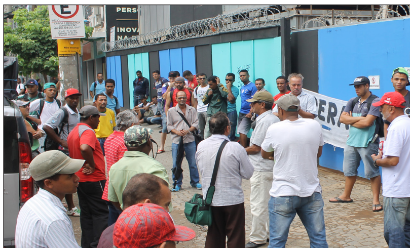
Adesão dos operários da Patrimar, rua Sergipe

Os operários da construção civil estão respondendo com firmeza o chamado do Sindicato. Não nos